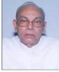
H E Shri Rameshwar Thakur Earlier Hon'ble Governor of Karnataka